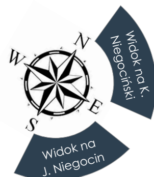
PLAN MIESZKANIA SKALA 1:100