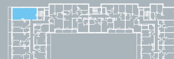
RZUT KONDYGNACJI Z ZAZNACZONYM MIESZKANIEM

■ Ściany konstrukcyjne i kominy - elementy stałe. ■ Ściany działowe nadające się do demontażu.