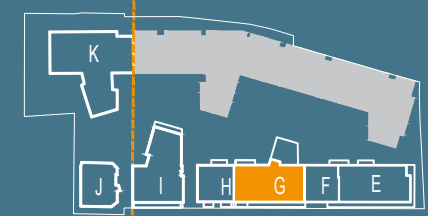
SCHEMAT PIĘTRA 6