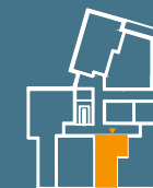
MODUŁ G | PARTER

■ Ściany konstrukcyjne i kominy - elementy stałe. ■ Ściany działowe nadające się do demontażu.