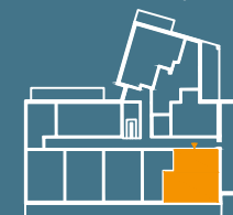
MODUŁ G | PIĘTRO 4

■ Ściany konstrukcyjne i kominy - elementy stałe. ■ Ściany działowe nadające się do demontażu.