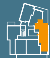
MODUŁ G | PIĘTRO 2