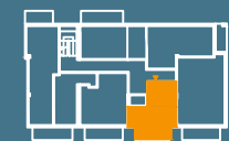
MODUŁ E | PIĘTRO 2

■ Ściany konstrukcyjne i kominy - elementy stałe. ■ Ściany działowe nadające się do demontażu.