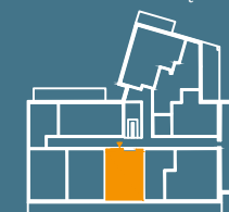
MODUŁ G | PIĘTRO 3

Ściany konstrukcyjne i kominy - elementy stałe. Ściany działowe nadające się do demontażu.