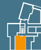
MODUŁ G | PARTER

■ Ściany konstrukcyjne i kominy - elementy stałe. ■ Ściany działowe nadające się do demontażu.