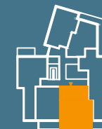
MODUŁ G | PIĘTRO 2

■ Ściany konstrukcyjne i kominy - elementy stałe. ■ Ściany działowe nadające się do demontażu.