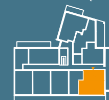
MODUŁ G | PIĘTRO 3

■ Ściany konstrukcyjne i kominy - elementy stałe. ■ Ściany działowe nadające się do demontażu.