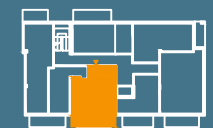
MODUŁ E | PIĘTRO 3

■ Ściany konstrukcyjne i kominy - elementy stałe. ■ Ściany działowe nadające się do demontażu.