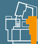
MODUŁ G | PIĘTRO 2

BIURO SPRZEDAŻY/SALES OFFICE Al. Gen. W. Sikorskiego 9c 02-758 Warszawa nordic.mokotow@yit.pl