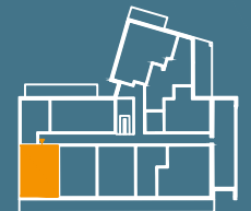
MODUŁ G | PIĘTRO 3

■ Ściany konstrukcyjne i kominy - elementy stałe. ■ Ściany działowe nadające się do demontażu.