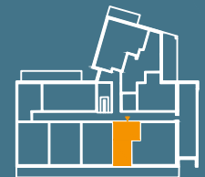
MODUŁ G | PIĘTRO 4

■ Ściany konstrukcyjne i kominy - elementy stałe. ■ Ściany działowe nadające się do demontażu.