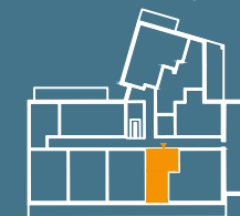
MODUŁ G | PIĘTRO 3

■ Ściany konstrukcyjne i kominy - elementy stałe. ■ Ściany działowe nadające się do demontażu.