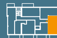
MODUŁ E | PIĘTRO 2