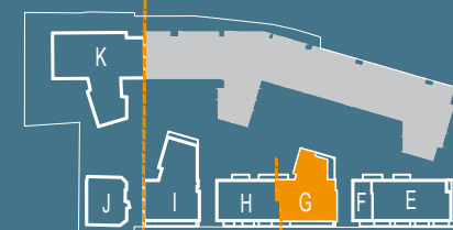
SCHEMAT PIĘTRA 1