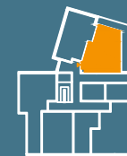
MODUŁ G | PIĘTRO 1

■ Ściany konstrukcyjne i kominy - elementy stałe. ■ Ściany działowe nadające się do demontażu.