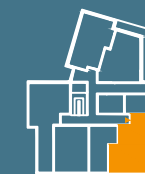
MODUŁ G| PARTER

■ Ściany konstrukcyjne i kominy - elementy stałe. ■ Ściany działowe nadające się do demontażu.