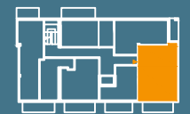
MODUŁ E | PIĘTRO 4

■ Ściany konstrukcyjne i kominy - elementy stałe. ■ Ściany działowe nadające się do demontażu.