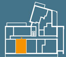
MODUŁ G | PIĘTRO 4

■ Ściany konstrukcyjne i kominy - elementy stałe. ■ Ściany działowe nadające się do demontażu.