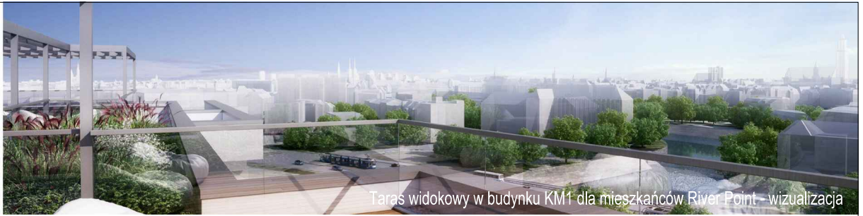
Taras widokowy w budynku KM1 dla mieszkańców River Point – wizualizacja

KM3-1/1/1/2k · 2 pokoje · 55.0 m 2 · 1. piętro · PB