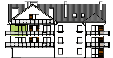
Elewacja boczna - wschodnia