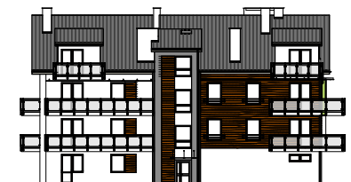
Elewacja boczna - zachodnia