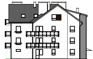
Elewacja tylna - północna