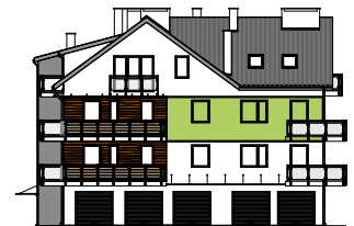
Elewacja frontowa - południowa