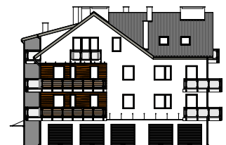
Elewacja frontowa - południowa