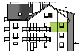
Elewacja tylna - północna