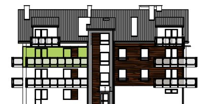
Elewacja boczna - zachodnia