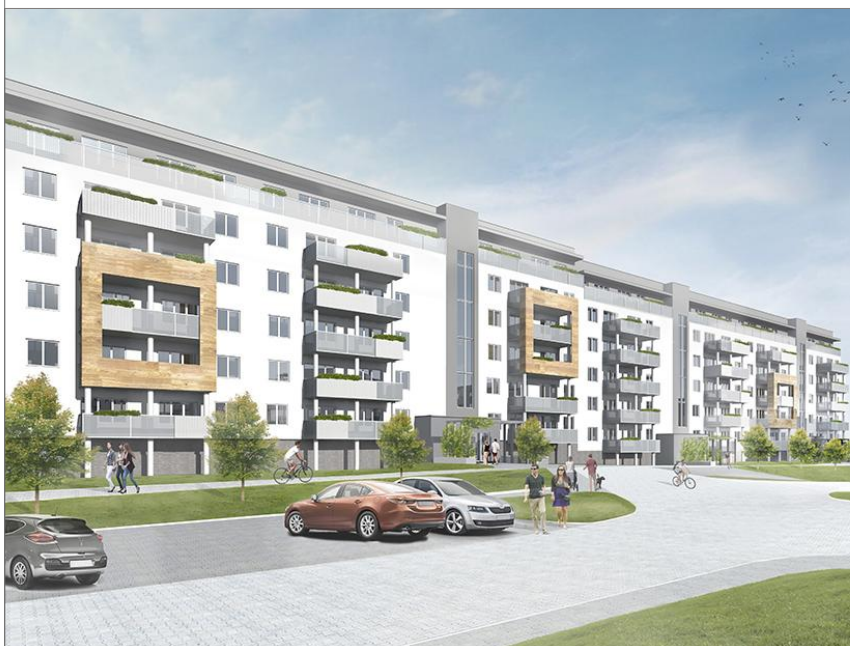
BUDYNEK NR 14

WYMIARY PODANO W ŚWIETLE ŚCIAN SUROWYCH. NINIEJSZE DANE SĄ POGŁADOWE I MOGĄ ODBIEGAĆ OD OSTATECZNEGO PROJEKTU REALIZACYJNEGO.