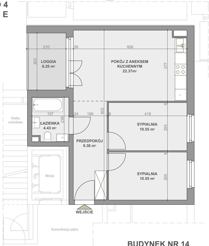
BUDYNEK NR 14

Powierzchnia zgodna z PN ISO 9836:1997 oraz z Rozporządzeniem Ministra Transp. Budownictwa i Gos. Morskiej z dnia 25.04.2012r.