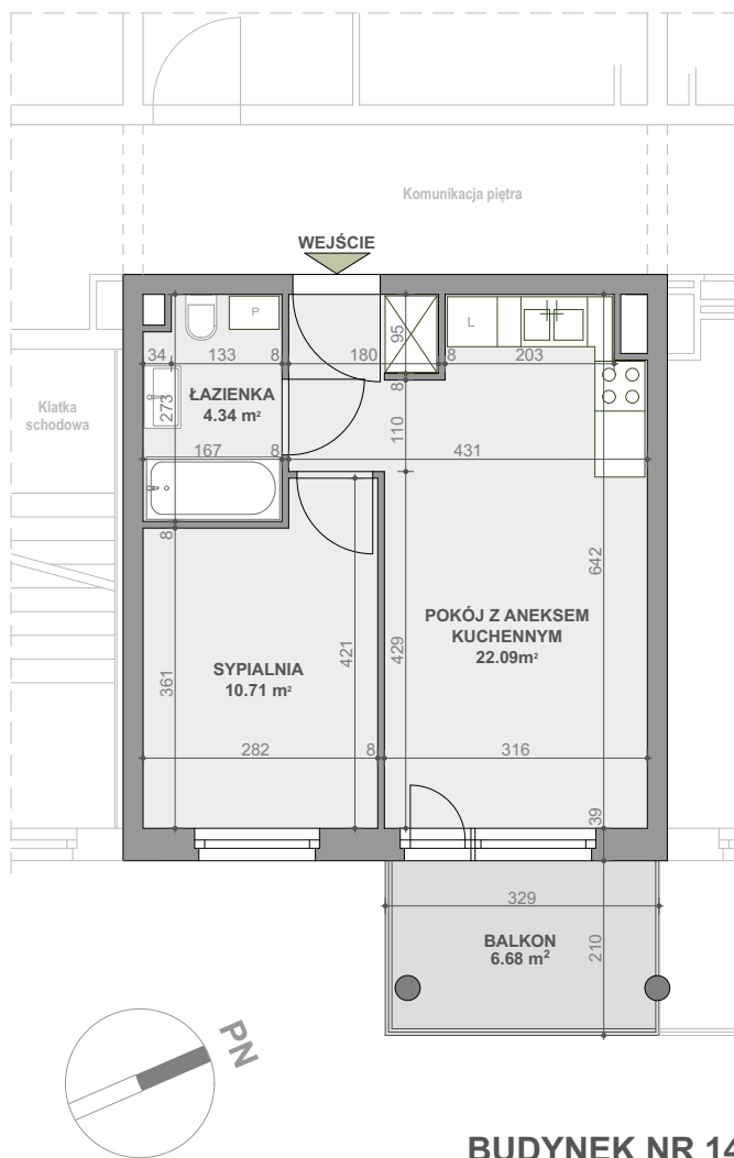
BUDYNEK NR 14

Powierzchnia zgodna z PN ISO 9836:1997 oraz z Rozporządzeniem Ministra Transp. Budownictwa i Gos. Morskiej z dnia 25.04.2012r.