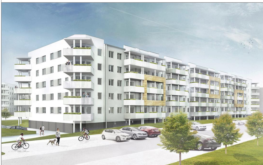
BUDYNEK NR 13

WYMAGANY PODANO W ŚWIETLE ŚCIAN SUROWYCH. NINIEJSZE DANE SĄ POGŁADOWE I MOGĄ ODBIEGAĆ OD OSTATECZNEGO PROJEKTU REALIZACYJNEGO.