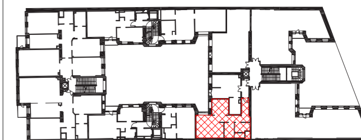
SCHEMAT V PIĘTRA