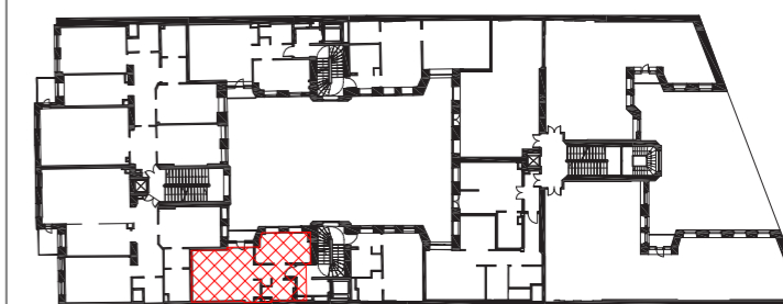
SCHEMAT V PIĘTRA