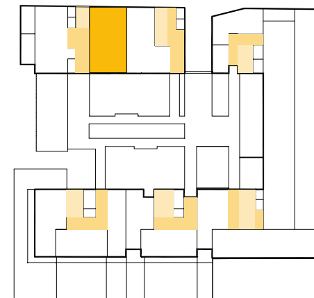
Schemat kondygnacji - parter