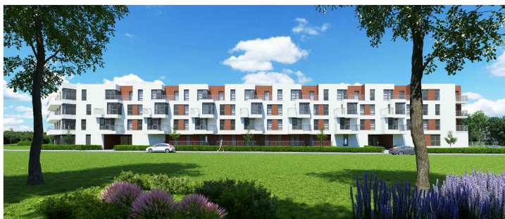
BUDYNEK WIELORODZINNY PRZY ULICY ZIELNEJ WE WROCŁAWIU