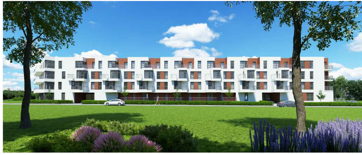
BUDYNEK WIELORODZINNY PRZY ULICY ZIELNEJ WE WROCŁAWIU