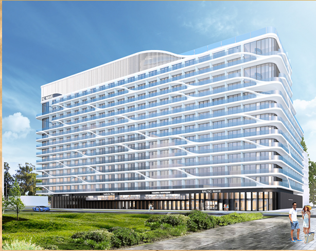
Wizualizacja obiektu / Object visualisation