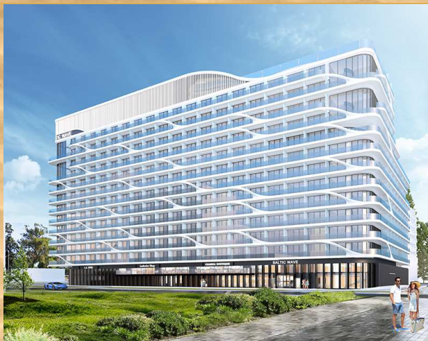
Wizualizacja obiektu / Object visualisation