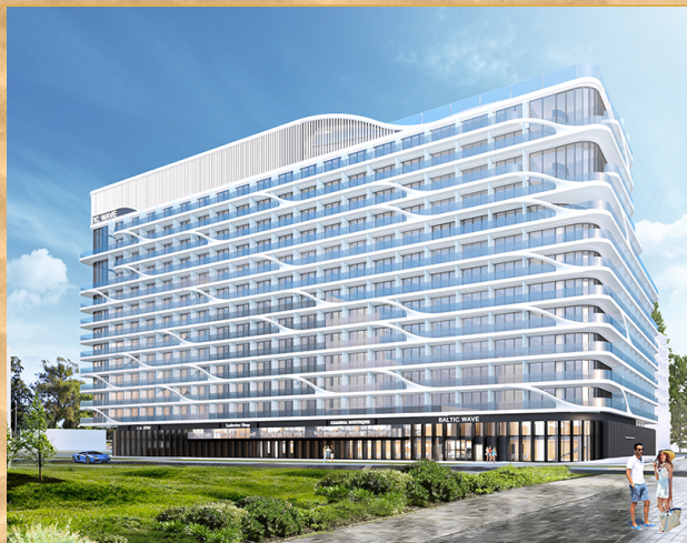
Wizualizacja obiektu / Object visualisation