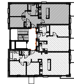
SCHEMAT 1 PIĘTRA