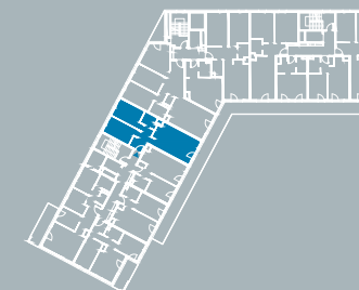
BUDYNEK A1 SCHEMAT