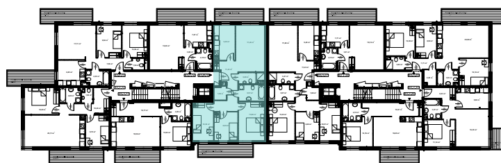
Rzut kondygnacji - II piętro