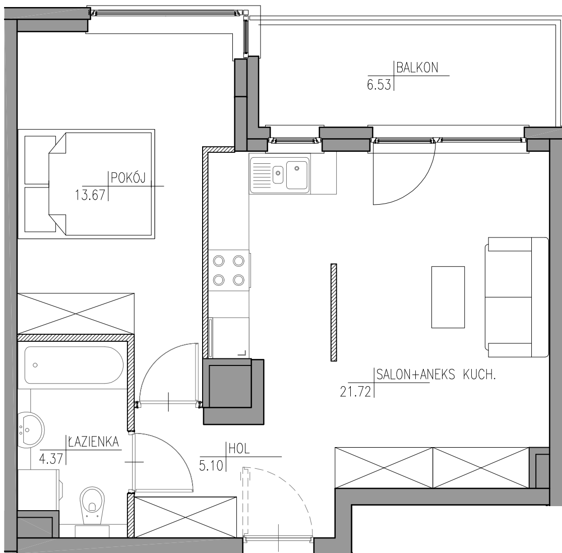
SCHEMAT LOKALU MIESZKALNEGO NA PIĘTRZE