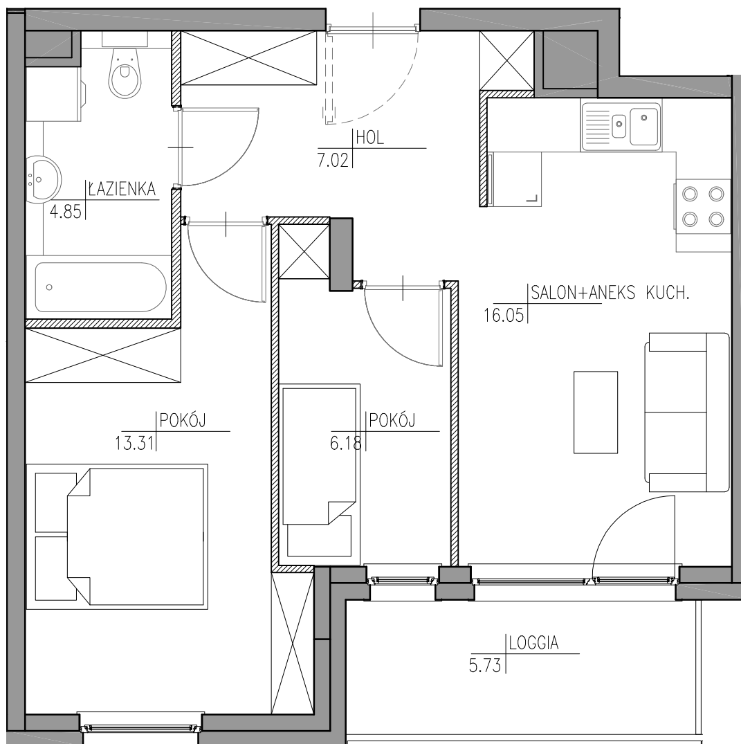
SCHEMAT LOKALU MIESZKALNEGO NA PIĘTRZE