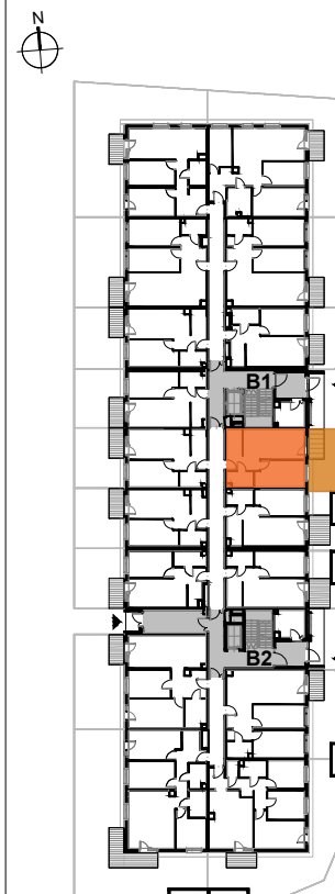
USYTUOWANIE MIESZKANIA NA KONDYGNACJI