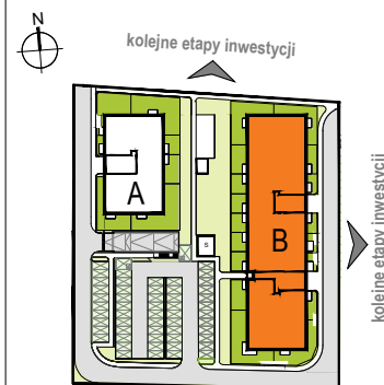
LOKALIZACJA BUDYNKU NA DZIAŁCE