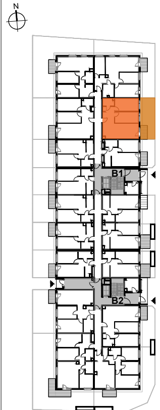
USYTUOWANIE MIESZKANIA NA KONDYGNACJI