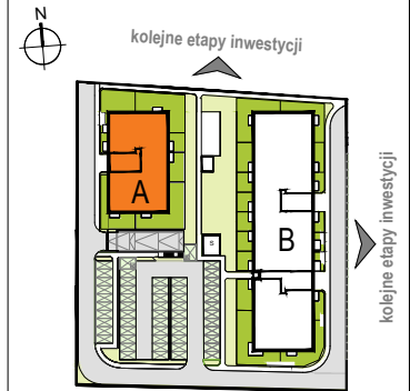
LOKALIZACJA BUDYNKU NA DZIAŁCE