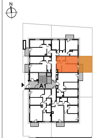
USYTUOWANIE MIESZKANIA NA KONDYGNACJI