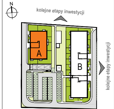
LOKALIZACJA BUDYNKU NA DZIAŁCE