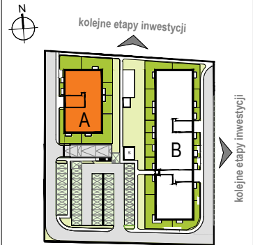
LOKALIZACJA BUDYNKU NA DZIAŁCE