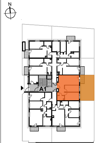
USYTUOWANIE MIESZKANIA NA KONDYGNACJI