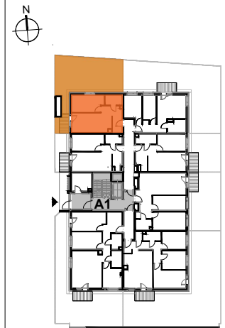
USYTUOWANIE MIESZKANIA NA KONDYGNACJI