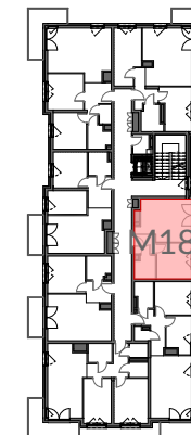
3 PIĘTRO SCHEMAT - LOKALIZACJA MIESZKANIA

Powierzchnie pomieszczeń liczone wg normy PN-ISO 9836:1997