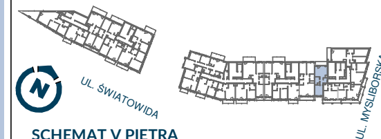
SCHEMAT V PIĘTRA