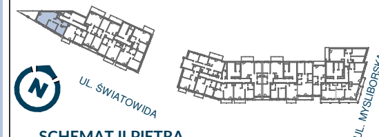
SCHEMAT II PIĘTRA